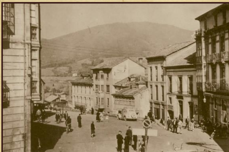
Plaza de María Cristina—Principios del siglo XX